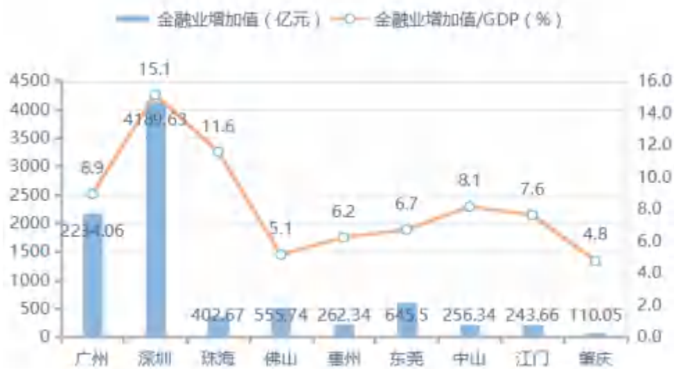
图 1：2020 年末珠三角城市金融业增加值及 GDP 占比图