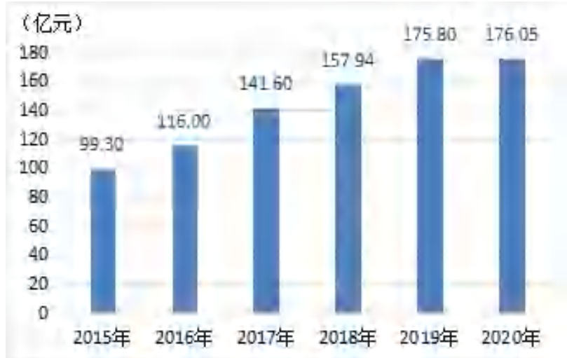
图 3：“十三五”期间惠州市保费收入情况

保险市场健康稳定发展。“十三五”期间，我市保险业持续健康发展。2020 年全市实现保费收入 176.05 亿元，较 2015 年增长 77.29%，年均增长 12.13%；保险密度和保险深度分别为 3607 元/人、4.2%，较 2015 年分别提高 1512 元、1 个百分点；全市各项赔付支出 49.33 亿元，比 2015 年增长了 17.59 亿元。保险种类涵盖涉农保险、大病二次补偿保险、人身意外伤害保险、健康保险、车辆保险、大病保险、自然灾害责任保险、巨灾保险等，保障金额 6.52 万亿元，为全市经济社会发展提供了有力保障。